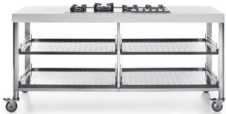
Piano cottura ad incasso e quattro ripiani estraibili inox. Built-in hob and four stainless steel pull-out shelves.