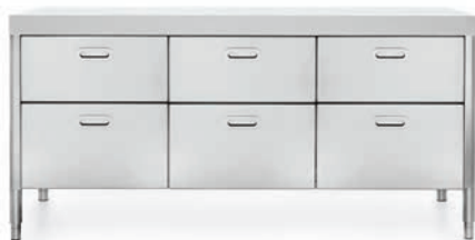
Top in Corian®, sei cassetti inox. Corian® countertop, six stainless steel drawers.