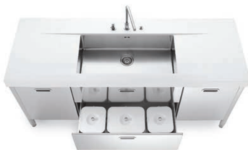
Vasca sottopiano, top in Corian®, due ante e due cassetti inox, raccolta differenziata. Undermounted sink, Corian® countertop, two stainless steel doors and drawers, separated waste disposal system.