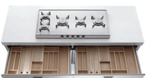
Piano cottura ribaltabile con cinque fuochi a gas in linea, top in Corian®, cassetti attrezzati. Flip-up hob with five aligned gas burners, Corian® countertop, accessorized drawers.