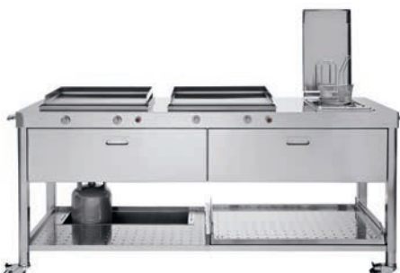
Carrello con top inox, piastra cottura inox a gas, friggitrice, due cassetti inox, ripiano estraibile e porta bombola. Trolley with stainless steel countertop, one stainless steel gas plancha, fryer, two stainless steel drawers, a pull-out shelf and gas cylinder storage.