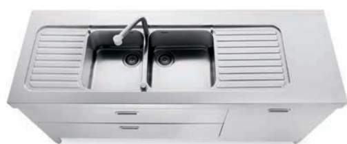
Lavello integrato al top inox con due vasche e due scivoli, due cassetti e anta per lavastoviglie inox. Sink integrated into the stainless steel countertop with two bowls and two draining-boards, two drawers and a dishwasher panel in stainless steel.