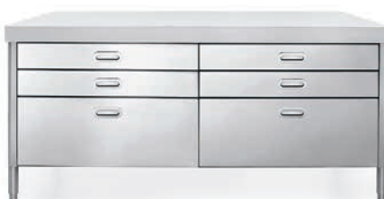
Top in Corian®, sei cassetti inox. Corian® countertop, six stainless steel drawers.