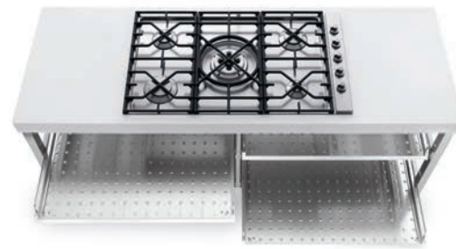
Piano cottura ad incasso con cinque fuochi a gas, griglia in ghisa, comandi laterali e quattro ripiani estraibili inox. Built-in hob with five gas burners, cast iron grids, side controls and four stainless steel pull-out shelves.