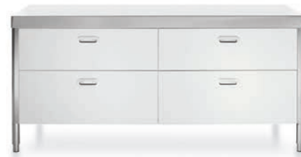
Top inox, quattro cassetti in laccato bianco. Stainless steel countertop, four painted-white wood drawers.