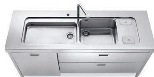
Lavello integrato al top inox con raccolta differenziata dall'alto, due cassetti e anta per lavastoviglie inox. Sink integrated into the stainless steel countertop with separated waste disposal from above, two drawers and a dishwasher panel in stainless steel.